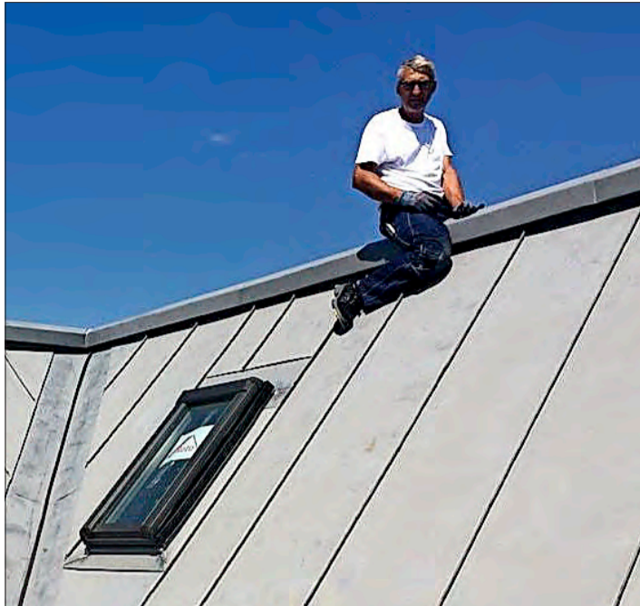
Der geschulte Blick des Fachmannes ist durch keine Maschine zu ersetzen.

„Da wir sehr individuell unterwegs sind, benötigen wir dennoch ein hohes Maß an menschlicher Arbeitskraft und Know-how“, schildert der Firmenchef. Deshalb gingen mit der Erstellung der neuen Halle auch Neueinstellungen einher, so dass die Belegschaft die Marke von 100 Fachkräften überschritten hat. Dass man diese am Markt fand,