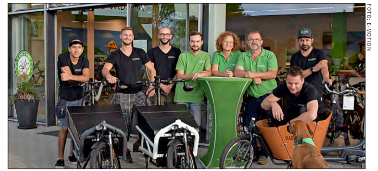
Das Team der E-Motion E-Bike Welt in Bad Krozingen

RATHBERGER GMBH Beim Breitenstein 25 79588 Efringen-Kirchen ☎ 07628/918330 www.rathberger-blech.de